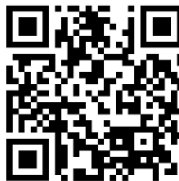
Film scolarité obligatoire (français)